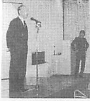
卒業祝賀会での祝辞

経営工学科同窓会会長の職には、益々ご健勝にてご活躍のこととお慶び申し上げます。 本年四月まで三期六年に亘り、経営工学科同窓会の会長を務めさせて頂きました。会員の皆様には、「協力」を標榜し、誠にありがとうございました。 この間経営工学科創設五十周年・同窓会四十周年の記念事業を開催することが出来ました。